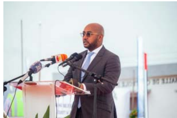
Le vice-président Moustapha Ben-Barka de la BOAD à l'inauguration à Blitta

Erigée en 18 mois, cette centrale est le fruit d'une admirable synergie d'action entre les différents bailleurs de fonds, et l'Etat togolais. En effet, les travaux, démarrés en octobre