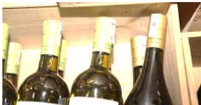
Du vin marqué avec la vignette OTR

ministre de l'Économie numérique et de la transformation digitale a déclaré que «la délivrance du passeport vaccinal contre la COVID-19 contribue à l'atteinte des objectifs de la feuille de route gouvernementale qui vise la digitalisation de tous les secteurs économiques du pays. À l'instar des pays de l'Asie ou encore de l'Union européenne, ce passeport infalsifiable et vérifiable est une preuve de vaccination qui facilitera la circulation de nos citoyens vaccinés sur le territoire et à l'étranger». Son collègue de la Santé, de l'hygiène publique et de l'accès universel aux soins, Prof. Moustafa Mijiyawa, renchérit : «la plateforme de vaccination et le passeport vaccinal facilitent énormément la vie des acteurs de santé et de la population. Les nombreux projets de digitalisation en cours et envisagés au ministère de la Santé vont bénéficier des retours d'expérience sur la plateforme de vaccination. Cela démontre la nécessité d'utiliser les nouvelles technologies et de s'appuyer sur le digital pour améliorer notre système de santé».