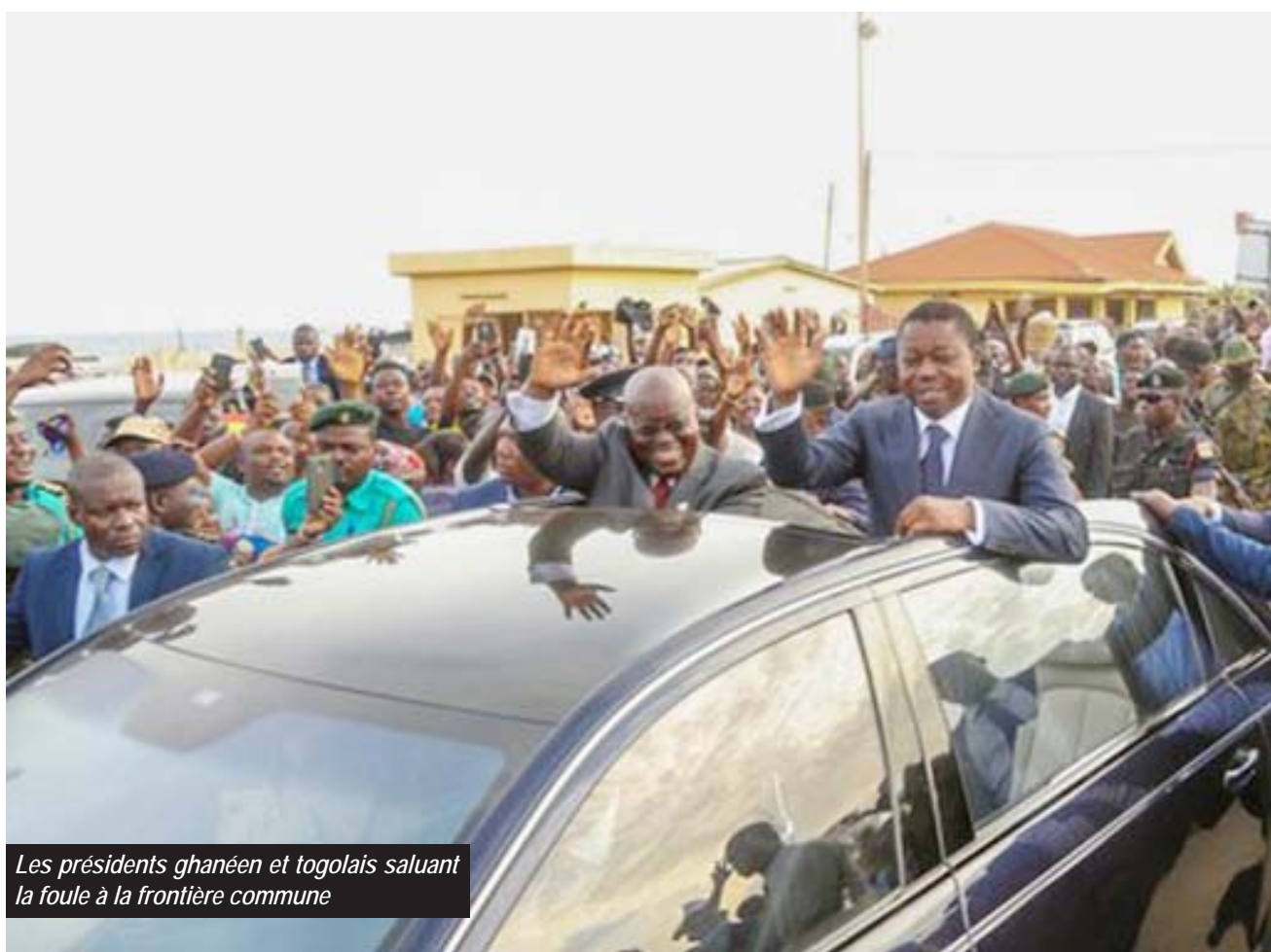
Les présidents ghanéen et togolais saluant la foule à la frontière commune

Différend frontalier à régler: après le maritime, le terrestre