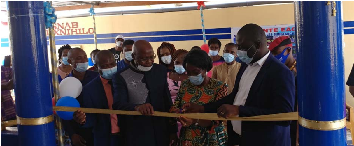
Coupe du ruban symbolique

Un centre régional polyvalent de développement ouvre ses portes à Lomé. L'information a été portée à l'endroit du public au cours d'une cérémonie de lancement des activités de ce centre qui a eu lieu le mercredi 29 juin dernier. Elle s'est déroulée en mode semi-présentiel (présentiel et virtuel).