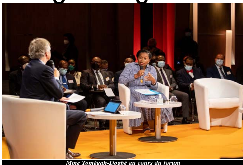
Mme Tomégah-Dogbé au cours du forum

Dans son discours d'ouverture, la Cheffe du gouvernement a saisi cette occasion pour exposer les réformes entreprises ces dernières années par le Togo dans le cadre de l'assainissement du climat des affaires dans le