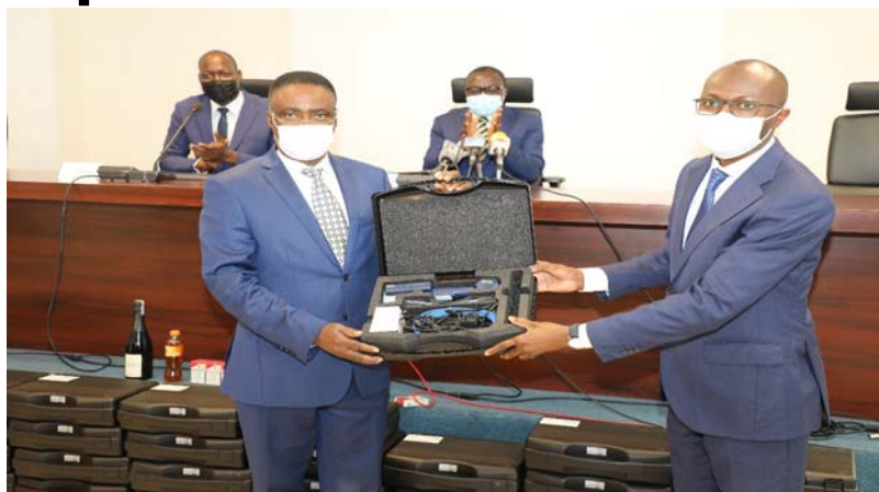
Remise symbolique du matériel

En effet, ils ont visité la frontière Togo-Ghana, et certains supermarchés de la capitale. Le constat en général, est que le marquage n'est pas encore effectif même si certains super-