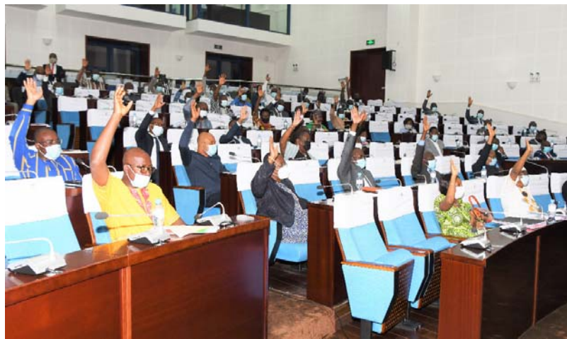
Les Députés à l'Assemblée Nationale

Depuis un certain moment, le gouvernement togolais a décidé de faire du numérique, un vecteur de croissance et de développement du pays. Aujourd'hui, cette volonté politique est sur la bonne voie mais se heurte à diverses activités criminelles qui s'intensifient sur les réseaux sociaux. Fort de ce constat, les élus du peuple ont trouvé opportun de voter des lois pouvant contrecarrer ces derniers.