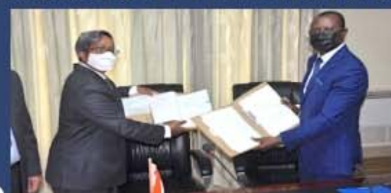
Echange de documents après la signature.

Le Togo bénéficie de 22 milliards de FCFA pour une nouvelle Centrale photovoltaïque P.5