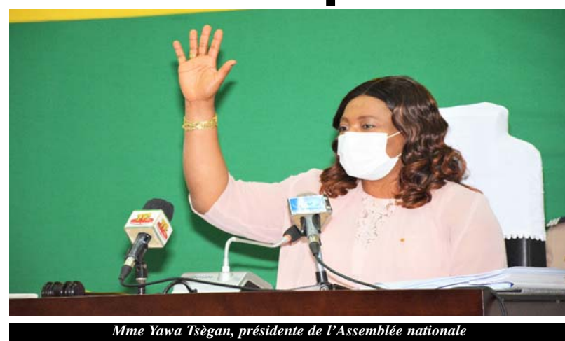
Mme Yawa Tsègan, présidente de l'Assemblée nationale

Ceci démontre selon elle, la détermination et la bonne volonté des élus locaux à conduire le pays