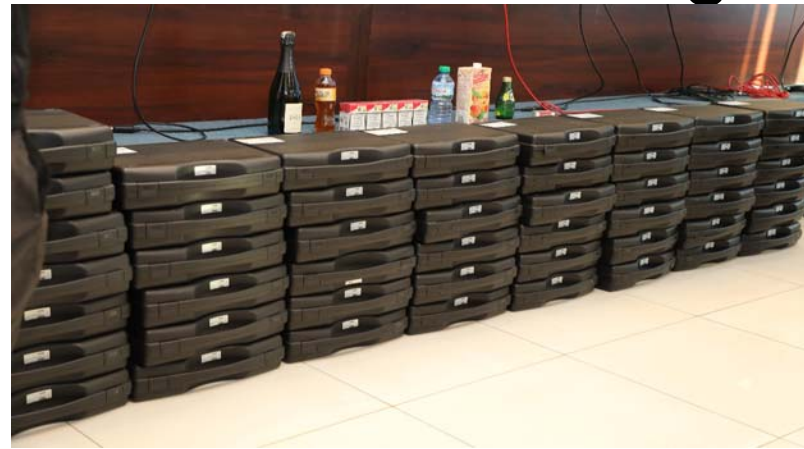
Le lot de matériel

ne leur a été donné pour régulariser la situation. Le marquage concerne les produits comme les boissons alcoolisées, les sodas, les eaux, les vins et les