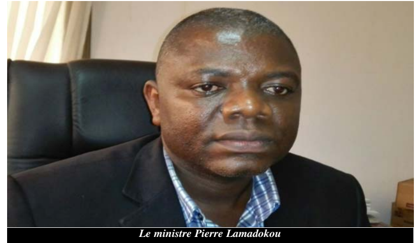
Le ministre Pierre Lamadokou

Pour le ministre LAMADOKOU, cette décision est à mettre à l'actif du chef de