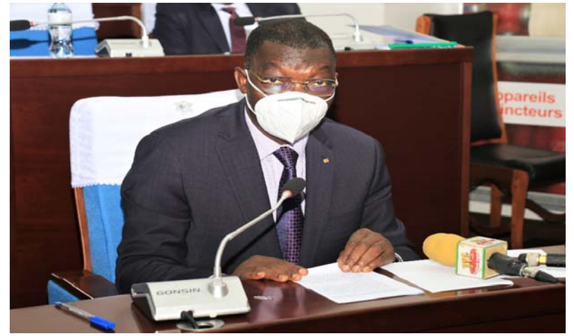
Le ministre Yark Damehame

nalité et la loi n° 2019-014 du 29 octobre 2019 relative à la protection des données à caractère personnel. Avec la ratification de ces deux lois par la représentation nationale, le Togo assurera une coopération efficace et efficiente en matière de cybercriminalité, de lutte contre le fléau et la protection des données à caractère personnel. Notons