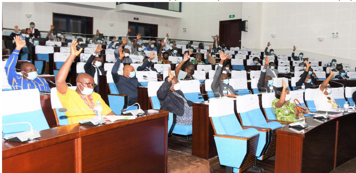
Une vue des députés à l'Assemblée nationale