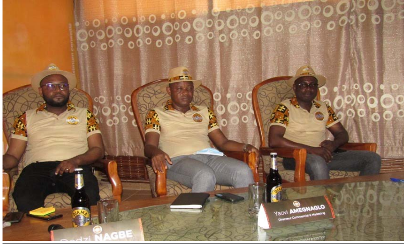
Les premiers responsables de la SNB

Depuis son installation au Togo, la Société Nouvelle de Boisson (SNB) ne cesse d'élargir sa gamme de produits. Après la Djama Pilsner, la Djama Lager et les Chap (cola, citron, cocktail et limonade) les premiers responsables apportent encore du nouveau sur le marché pour le plaisir des consommateurs.