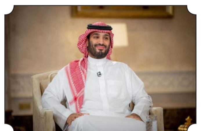
• Le prince héritier Mohammed ben Salmane, le 27 avril 2021, à Ryad.

L'Arabie saoudite compte déjà une compagnie nationale, Saudi Arabian Airlines, qui, de plus en plus concurrencée, subit des pertes depuis des années.