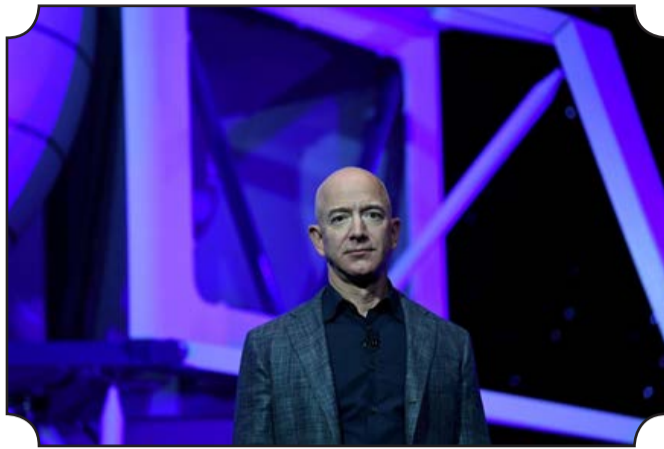
• Jeff Bezos va quitter lundi le poste de CEO d'Amazon, une entreprise qu'il a créée il y a 27 ans.