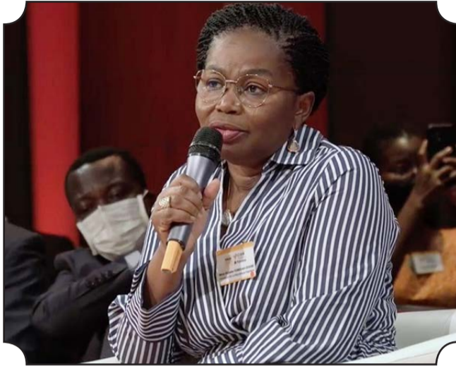
● Le Premier ministre du Togo, Victoire Tomégah-Dogbé

ment la Plateforme industrielle d'Adétikopé (PIA) et les centrales thermique Kékéli et photovoltaïque de Blitta. Aussi a-t-elle rappelé la gestion efficace de la pandémie avec plusieurs mesures de riposte, d'accompagnement des couches sociales et des entreprises. Elle a rappelé l'ambition du Togo de transformer structurellement l'économie et de créer l'emploi, conformément à la feuille de route gouvernementale 2020-2025. Le Premier ministre a ainsi invité les opérateurs économiques français à investir davantage au Togo pour un partenariat gagnant-gagnant. Les interventions des membres de la délégation togolaise au cours de ce forum ont bénéficié d'une attention particulière des participants qui ont pu apprécier la pertinence de la vision économique de notre pays. Par ailleurs, le Togo a présenté les différentes opportunités d'investissement lors d'un atelier dont le thème était la transformation agro-industrielle au Togo. Le Premier Ministre a ouvert l'atelier en invitant les investisseurs à poser toutes les questions. Le secteur privé a été invité à faire sa part belle des opportunités d'investissements à travers les différents projets phares de la feuille de route gouvernementale qui indubitablement constituent les piliers du développement économique du