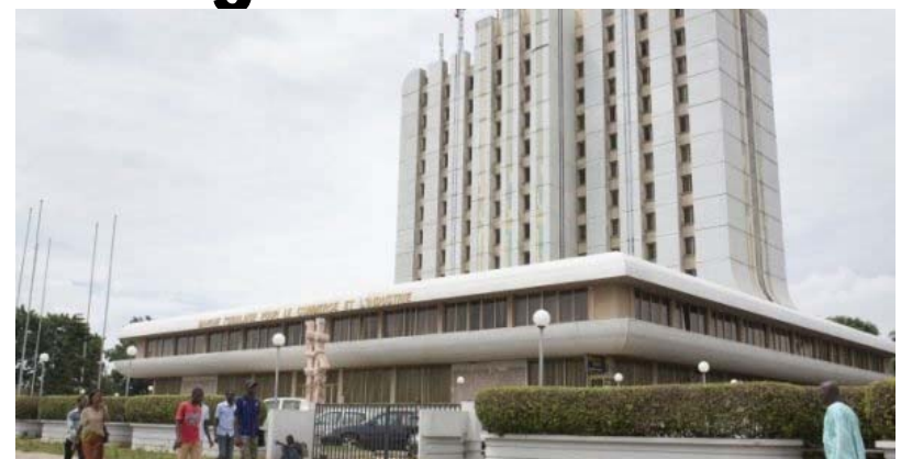
Le siège de la BTCL à Lomé.

IB holding n'est pas un novice, mais une institution qui a fait ses preuves et convaincu,