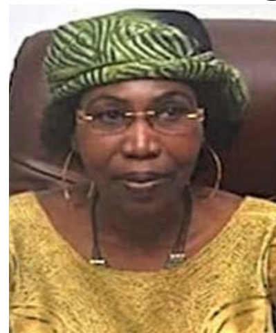
Feu Nakpa Polo

Ce travail titanesque abattu par cette dame de caractère en si peu de temps rappelle le passage à la tête de cette institution du premier