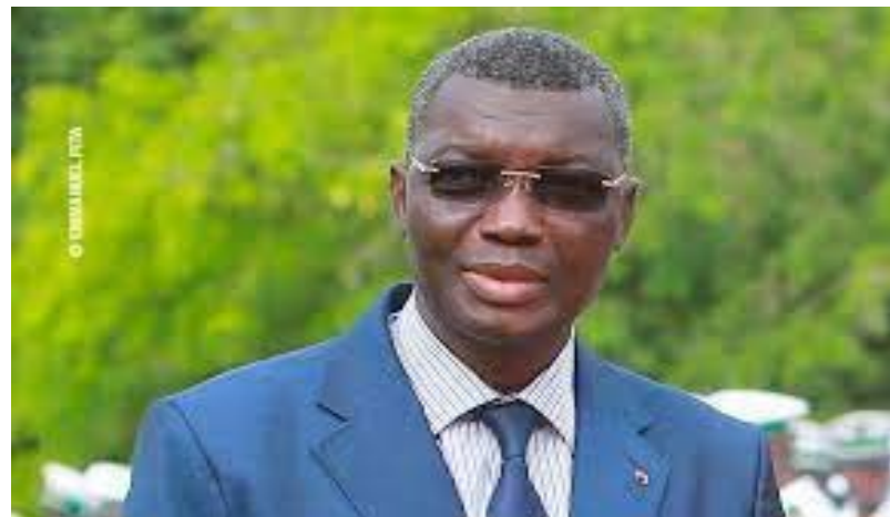
Gal Yark Damhemame, ministre de la Sécurité

interpellées, 30 fusils de chasse, 16 cartouches de calibre 12 mm, deux pistolets de fabrication artisanale, trois paires de menottes, trois couteaux poignards, une voiture, 59 motos, du cannabis, 6 sacs de maïs de 25 kg et divers effets militaires saisis.