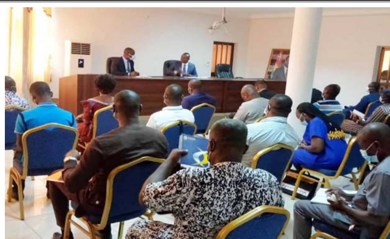
Une vue de l'assistance lors de la rencontre.

point, grâce à des échanges d'orientation sur les actions futures pour une