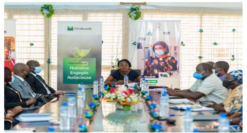
Une vue de l'assistance lors de la cérémonie

Fort de ce progrès en phase avec l'engagement du Président de la République, son Excellence Faure Essozimna Gnassingbé lors de son lancement, un rehaussement du plafond de