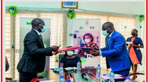
Echange de documents