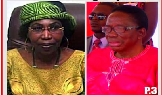
Feu Nakpa Polo