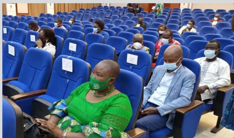
Une des acteurs des médias lors de la rencontre.

Face à la percée inquiétante de la Covid-19, avec l'apparition de variants, le gouvernement togolais a décidé de revoir la communication autour de la pandémie. Une rencontre d'échanges a été initiée avec les médias le lundi 16 août dernier.