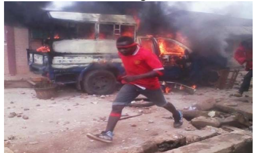
Certains dégâts de l'insurrection du 19 août 2017.

A l'heure où Faure Gnassingbé et son gouvernement ont mis le pied sur l'accélérateur pour offrir à