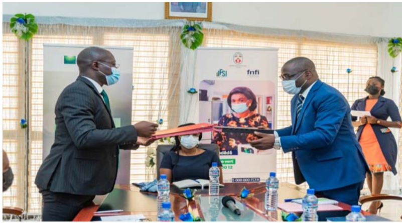
Echange de documents

Selon les premiers bilans, à la date du 15 Aout 2021, les Micros, Très Petites, et Moyennes Entreprises (MTPME) créés