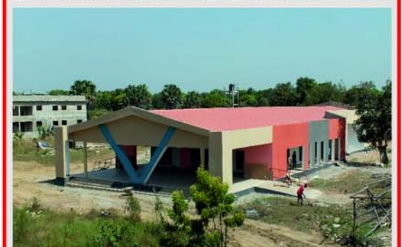
IFAD Elevage de Barkoissi