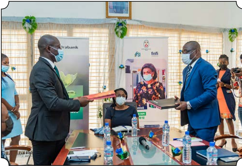
• Echange de paraphes entre le DG / Orabank Togo et le DG / FNFI

lancement en janvier 2020, les résultats ont été significatifs et l'impact réel sur le soutien entrepreneurial et l'inclusion financière des populations. Selon les premiers bilans, à la date du 15 Août 2021, les Micros, Très Petites, et Moyennes Entreprises (MTPME) créées par les bénéficiaires ont bénéficié de financement pour un montant total de 238 000 000 FCFA avec un taux de remboursement de 100%. Pour les autorités, c'est un pari réussi. C'est fort de ce progrès et en cohérence avec l'engagement du Président de la République, son Excellence Faure Essozimna Gnassingbé lors de son lancement, qu'un rehaussement du plafond de crédit N'Kodédé a été décidé à travers la mise en place du cycle 2. D'un montant maximum et inédit de 10 000 000 FCFA, N'Kodédé cycle 2 est accordé aux bénéficiaires du premier cycle ayant honoré leurs engagements sans incidents auprès de ORABANK-Togo. Son taux d'intérêt est de 7% remboursable sur 36