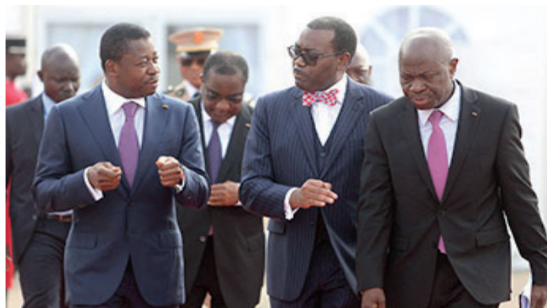
Gilbert Houngbo (extrême droite) toujours proche de son pays (image archive lancement du Mifa 2018)

Le Togo a toujours bénéficié d'une attention particulière du FIDA (PNPER, ProMifa etc.). Le président Houngbo signale qu'outre deux grands projets soutenus par son institution au Togo, un autre projet, à caractère régio-