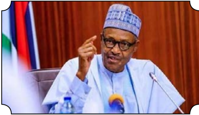
● Le président nigérian Muhammadu Buhari

Ceci constitue la troisième hausse trimestrielle consécutive de croissance après les taux négatifs enregistrés aux deuxième et troisième trimestres 2020. Cette reprise, indique-t-on, s'explique par le retour progressif de l'activité commerciale ainsi que des déplacements locaux et internationaux. Les trimestres 2 et 3 de l'année 2020 étant marqués par les restrictions imposées dans le pays pour lutter contre la propagation du coronavirus (Covid-19). Cette hausse de croissance est portée par le secteur non pétrolier qui a progressé de 6,74 % en termes réels tandis que le secteur pétrolier a reculé de 12,65 %. Pour