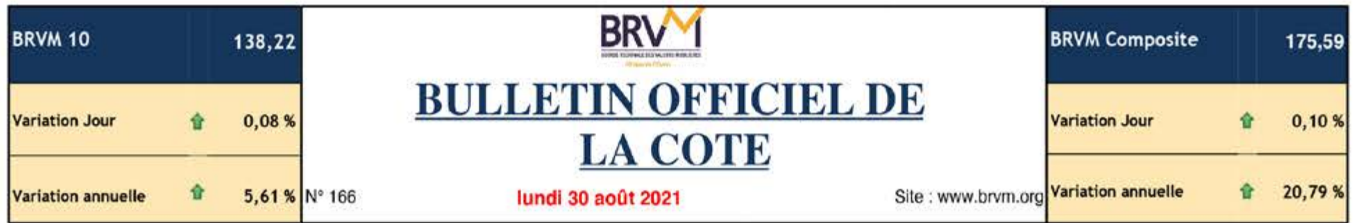
Evolution des indices