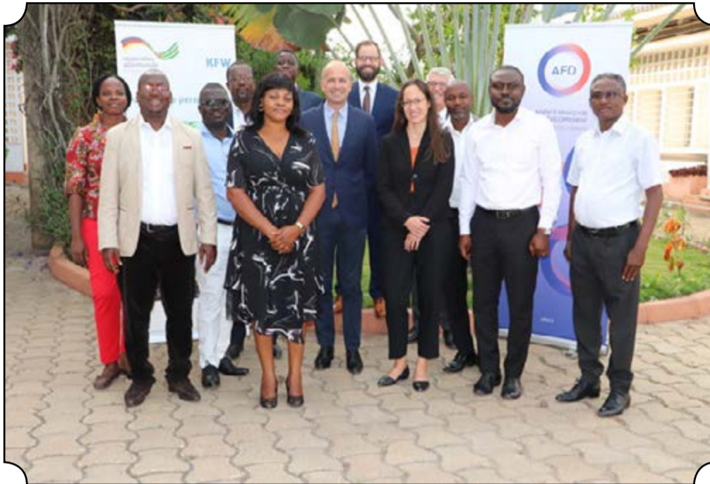
• AFD-KfW, deux acteurs au développement plus proches que jamais