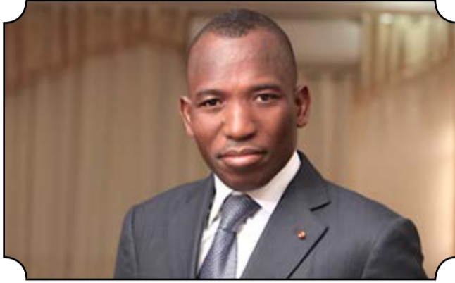
• Le Ministre de la fonction publique, du travail et du dialogue social, Gilbert Bawara.

Le gouvernement togolais annonce des mesures pour les secteurs de la santé et de l'éducation. Proclamation des résultats du dernier concours de recrutement du personnel médical, paramédical et administratif. Pour rappel, 698 postes avaient été ouverts. Parallèlement, des discussions vont se poursuivre "avec le collectif des syndicats de la santé afin de répondre aux besoins prioritaires en personnels et de résorber de manière progressive le déficit en personnel soignant". D'autres concertations, entre les ministres chargés des finances et de la santé et des structures concernées par la gestion de la Covid-19 (CNG), auront également lieu, en vue de résoudre les questions liées aux traitements des personnels et la mise en place d'un nouveau dispositif. Le Gouvernement s'est en outre engagé à accélérer les démarches pour l'équipement des CHU en scanners (via une approche partenariat public-privé), les préoccupations des personnels contractuels, la mise en place d'une fonction publique hospitalière, ou encore les arriérés de l'Etat dans le cadre de sa contribution aux hôpitaux publics. Les dispositifs de prise en charge des victimes du Covid-19 seront eux aussi revus et améliorés