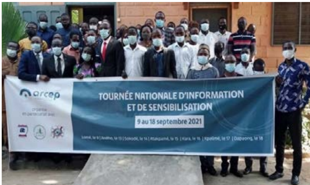
Photo de famille avec les participants à Lomé