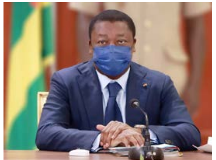
Faure Gnassingbé, président de la République

L'Amu permet à travers un système global, cohérent et intégré de réduire la charge des dépenses de soins de santé notamment