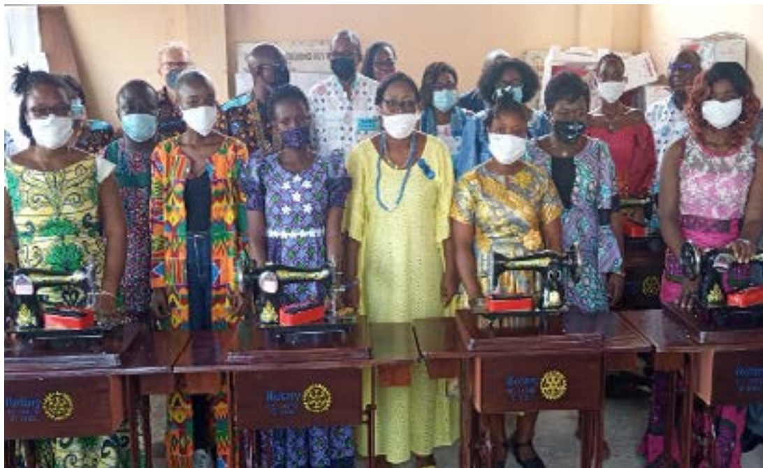
Photo de famille de la cérémonie de remise

Rotary club Lomé Doyen, dans sa mission de « Servir pour changer des vies », a offert des machines à coudre aux jeunes filles issues du Centre d'entraide des démunis pour l'apprentissage de la couture (Cedac). Une cérémonie de remise des matériels s'est tenue, hier 09 septembre 2021 à Lomé, au siège de la Chambre régionale des métiers, en présence des rotariens, des jeunes filles, des parents et du gouverneur du district 9102 de Rotary.