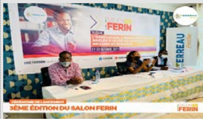
Table d'honneur du lancement

La réussite de la mise en œuvre du développement industriel inclusif et durable dans la présente étape de la