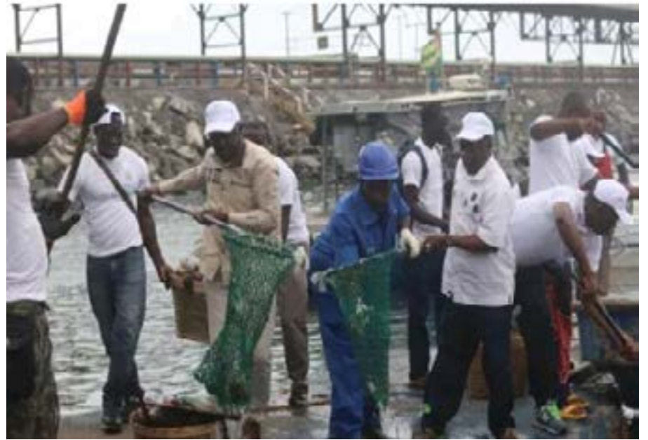
Des travailleurs dans le secteur de la mer

gouvernementale visant à faire de l'économie bleue, un des leviers du développement au Togo. Via le Port de Lomé et son énorme potentiel (port ben eau profonde, ressources halieutiques), le Togo ambitionne d'être un véritable hub-transportaire incontournable dans la sous-région. La création de l'Institut des métiers de la mer (I2M) est la résultante de la Stratégie nationale pour la Mer et le Littoral mise en route par le gouvernement togolais pour renforcer la sécurité maritime, promouvoir les opportunités d'emplois et le partenariat public-privé, moderniser le tourisme, développer l'économie bleue et gérer durablement l'environnement marin.