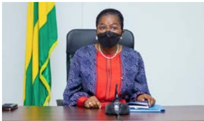
Le Premier ministre Victoire Tomégah-Dogbé

La situation sanitaire du coronavirus au Togo est en train de prendre des tournures inquiétantes. Tous les spécialistes sont unanimes sur le fait qu'on est sur une pente glissante. Cette situation a même poussé le Premier ministre Victoire Tomégah-Dogbé à rencontrer il y a quelques jours, les acteurs impliqués dans la riposte afin d'envisager la prise de mesures idoines. Mais, que peuvent-elles être ?