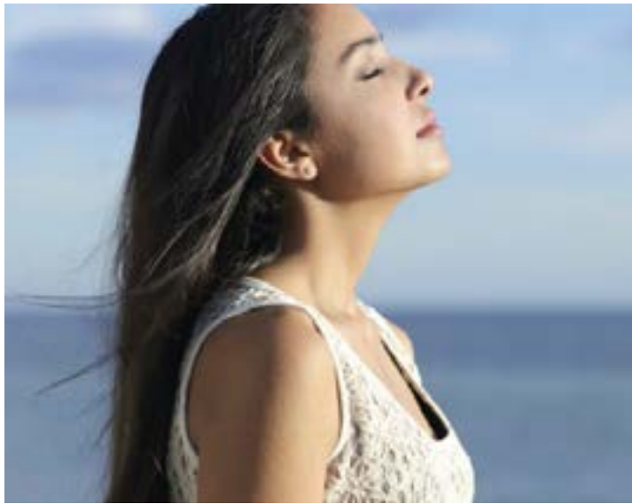
Une femme pratiquant une forme de respiration

« Cette technique réduit les sécrétions de cortisol, l'hormone du stress, et limite son impact sur le cœur : diminution de la fréquence cardiaque, de la pression artérielle, et même du taux de sucre dans le sang ». En effet, la cohérence cardiaque stabilise les variations de la fréquence cardiaque, autrement dit l'intervalle entre deux contractions du cœur. « Cela réduit les signes de tension et d'anxiété et nous rend plus confiant ». Avant de passer un