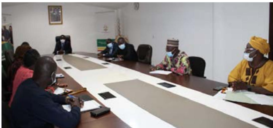
Des participants à la séance

de cette grande rencontre aux investissements. La journée économique Togo à Dubaï se tient le 19 décembre prochain. Il s'agira à travers cette journée de présenter les opportunités et les facilités d'investissement au Togo et de connecter les entrepreneurs togolais à leurs homologues du reste du monde à travers des rencontres d'affaires B to B. « Il s'agira pour notre pays de s'affirmer comme un pays totalement intégré au sein de la communauté internationale, de faire connaître à la communauté internationale l'innovation et l'ingéniosité togolaises en présentant des réalisations et inventions réalisées, de profiter de ce grand rendez-vous mondial pour promouvoir les opportunités d'investissement mais