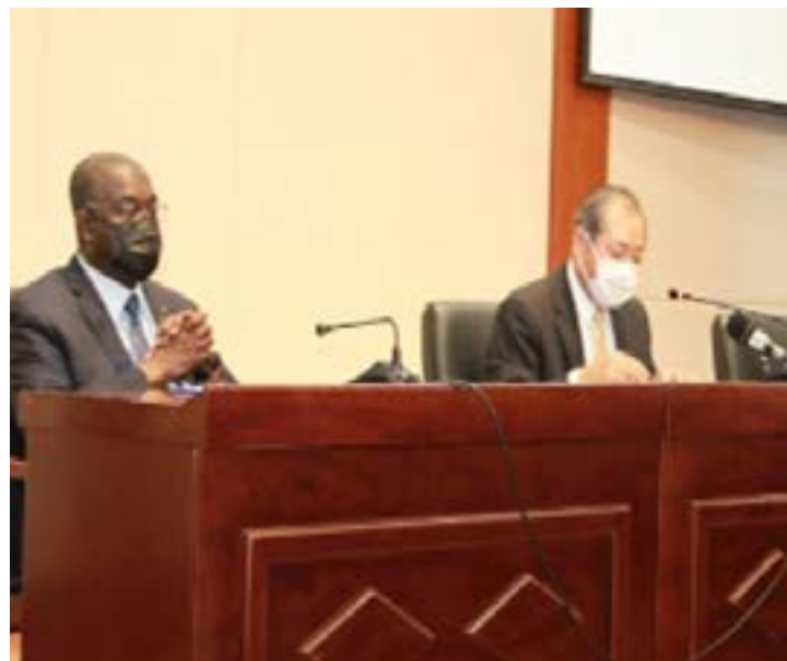
Les officiels à la signature

Le Japon et le Togo ont signé mardi 16 septembre à Lomé, une convention dans le cadre du projet d'assistance alimentaire japonais « Kennedy Round (KR) » et du Projet de développement économique et social (PDES) 2021. Le « pays du soleil levant » appuie le Togo avec environ 2,5 milliards FCFA.