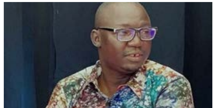
Honorable Gerry Taama

La stratégie adoptée semble porter des fruits. Depuis lundi dernier, ce sont des milliers de Togolais qui se font vacciner chaque jour. Le gouvernement ambitionne de vacciner un million de personnes d'ici la fin de l'année 2021. Mais, la question revient toujours : qu'est-ce qui a bien pu pousser les parlementaires à accorder 12 mois supplémentaires au gouvernement dans le