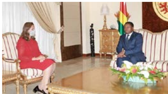
Faure Gnassingbé et Amani Abou-Zeid

Le commissaire à l'infrastructure et à l'énergie de la Commission de l'Union africaine a également partagé avec le chef de l'Etat la situation du transport aérien africain qui traverse une grave crise depuis le début de la pandémie à la Covi-19.