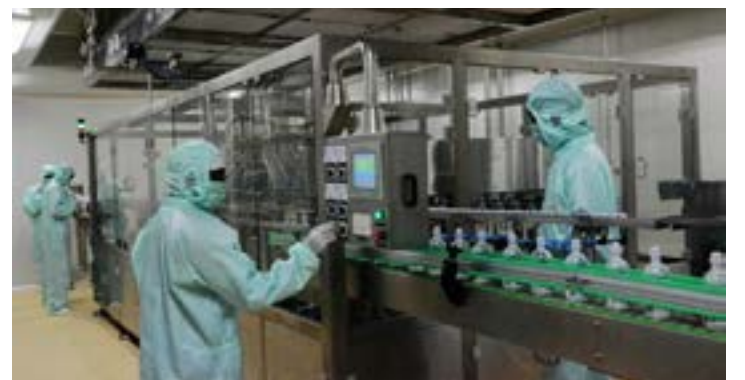
Une usine de fabrication de médicaments

Lors de la pandémie du coronavirus, il y a eu des initiatives africaines qui ne sont pas allées loin. On peut citer le Covid organics de Madagascar et l'Apivirine du