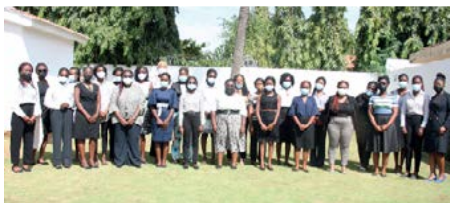
Les 60 filles togolaises bénéficiaires du PEFA

Le Programme national de développement (PND/2018-2022) reste le fer de lance des actions pour le développement du Togo. Ainsi, dans l'optique du PND, le Togo entend