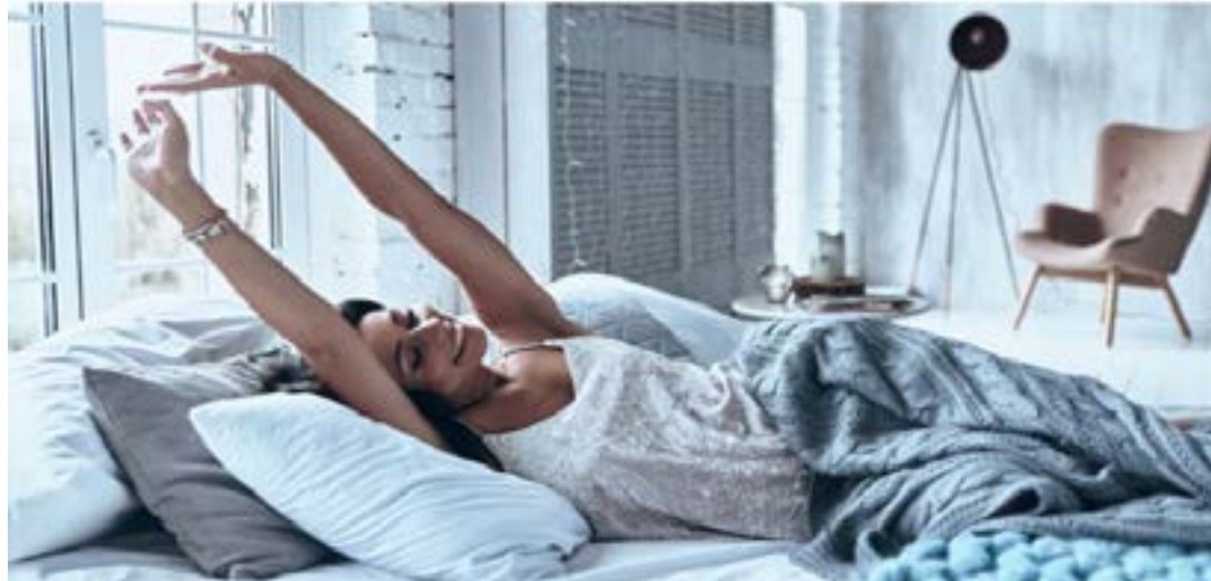
Une femme s'étire à son réveil

Vous avez envie de vous réveiller tôt le matin, mais en même temps, vous craignez d'accumuler de la fatigue. Comment faire ? Cet article vous donne des astuces nécessaires pour garder l'équilibre.