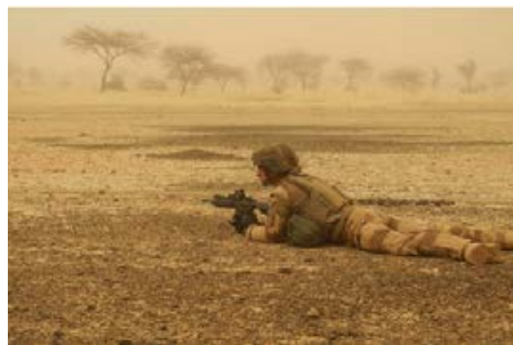
Un membre des forces françaises au Mali

désigné comme « ennemi prioritaire » au Sahel, lors du sommet de Pau (sud-ouest de la France), en janvier 2020. Il est en effet considéré comme étant à la manœuvre de la plupart des attaques dans la région des « trois frontières », un vaste espace aux contours vagues à cheval sur le Mali, le Niger et le Burkina Faso. Fin 2019, l'EIGS avait mené une série d'attaques d'ampleur contre des bases militaires au Mali et au Niger. Et le 9 août 2020,