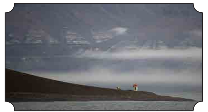
• L'archipel norvégien du Svalbard où est située la dernière mine de charbon du pays.