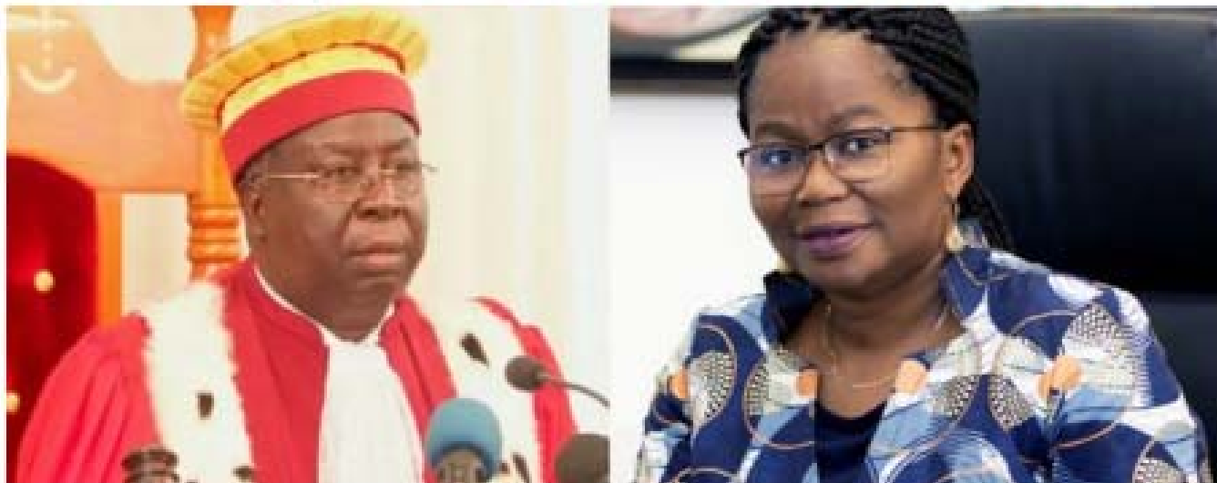
Aboudou Assouma, Président de la Cour Constitutionnelle

Obligation de preuve de vaccination ou test PCR négatif : Quand la Cour constitutionnelle conforte la décision du gouvernement P.3