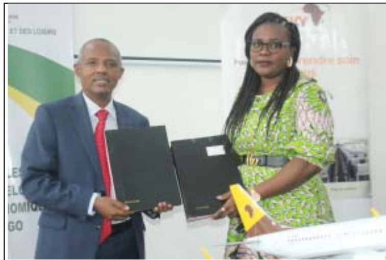
Echanges de paraphe entre le Représentant d'ASKY et la ministre des Sports

« Le sport étant une activité unificatrice, on ne peut nier l'importance que prennent les activités physiques et sportives dans la vie des individus. Asky se réjouit de ce partenariat gagnant-gagnant entre le Ministère des Sports et des Loisirs et la Compagnie Aérienne Panafricaine. Ce présent partenariat entre le Ministère et nous permettra à toutes les Fédérations sous tutelle du Ministère de prendre part aux différentes