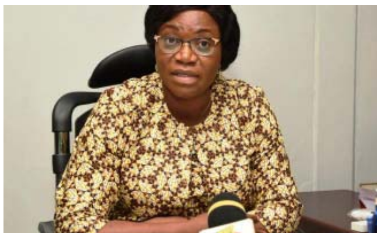
Mme Adjovi Lolonyo Apédoh-Anakoma, ministre de l'Action Sociale, de la Promotion de la Femme et de l'Alphabétisation

Le Togo a, à l'instar des autres pays, commémoré la 10 ème édition de la Journée internationale de la jeune fille (JIJF) le lundi 11 octobre 2021. Placée sous le thème : « La génération numérique notre génération », la célébration de la journée dédiée à la jeune fille est marquée par une conférence-débat virtuelle autour de la promotion de la jeune fille dans le numérique. Une initiative de Mme Adjovi Lolonyo Apédoh-Anakoma, Ministre togolais de l'Action sociale, de la promotion de la femme et de l'alphabétisation.