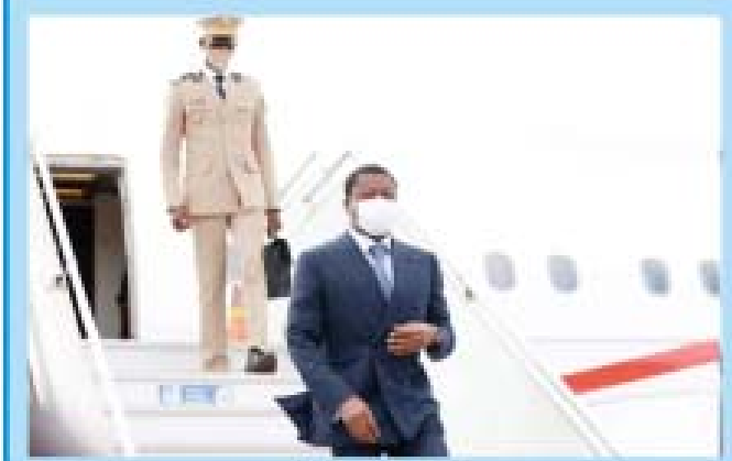
Le Chef de l'Etat Faure Gnassingbé

Faure Gnassingbé en visite de travail à Nouakchott P.4