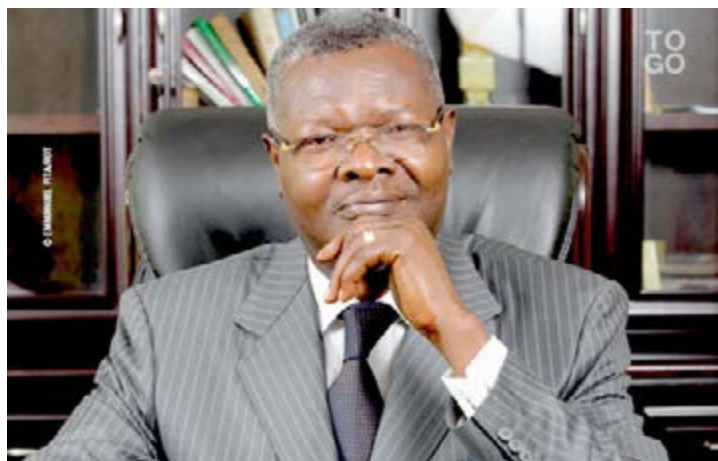
Agbéyomé Messan Kodjo

Parmi les deux challengers sérieux du président sortant Faure Gnassingbé, figure l'ancien Premier ministre du Togo, Agbéyomé Messan Kodjo. Contrairement à son rival Jean-Pierre Fabre de l'Alliance nationale pour le changement (ANC), ce dernier reçoit déjà des soutiens de leurs collègues de l'opposition. Un candidat vient même de se désister en sa faveur. Mais cela suffira-t-il à monsieur Kodjo pour prendre le dessus ?