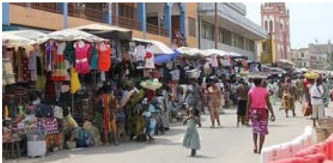
Un marché au Togo

Cependant, malgré ces perspectives plutôt positives, les pays des zones économiques utilisant le CFA font face à de nombreux défis. Les plus saillants, en Afrique de l'Ouest, étant notamment les défis de gouvernance, mais aussi des problèmes liés à des questions sécuritaires et sociales. « Le Niger et le Mali sont plus à risque géopolitiquement