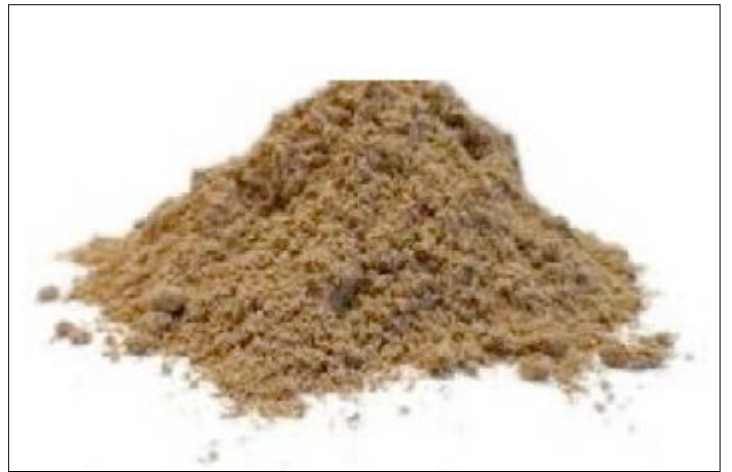
Le tabac vaginal (la drogue du vagin)