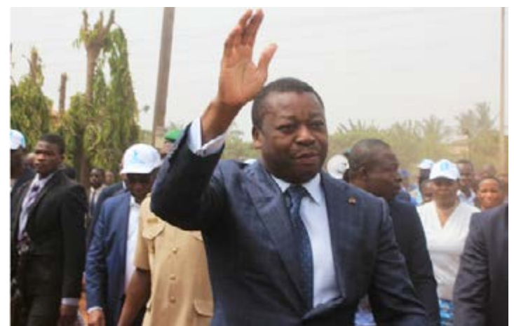
Faure Gnassingbé juste après son investiture

En d'autres termes, pour eux, Faure Gnassingbé est tellement populaire qu'il ne donnera aucune