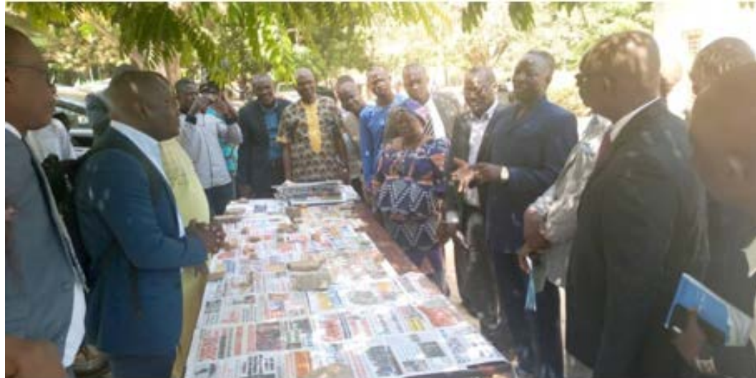
Les patrons de presse en compagnie du préfet de Kara

La 6 è édition des Journées Portes Ouvertes de la presse (JPO) a officiellement démarré hier mercredi 15 janvier 2020 à Kara (420 km au nord de Lomé) autour du thème : « Média, facteur de cohésion sociale ». La cérémonie d'ouverture s'est déroulée en présence du Préfet de la Kozah, Colonel Hémou Badibawou Bakali, des élus locaux, du représentant du président de l'Université de Kara ainsi que de nombreux étudiants.