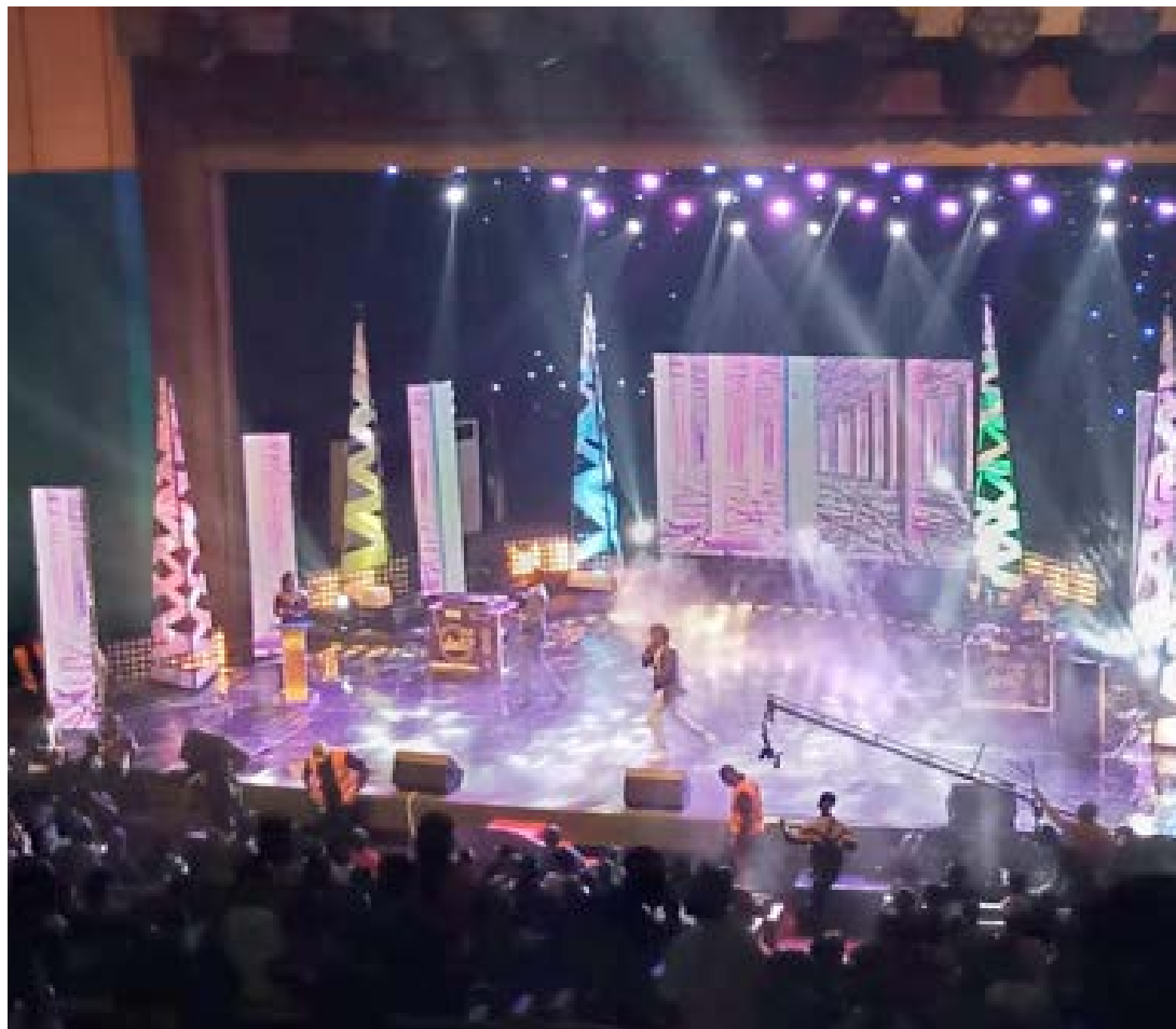
Lors de la soirée « The Heroes 228 »

Évènement qui prime les acteurs culturels, « The Heroes 228 » pour une cinquième fois consécutive, a tenu sa parole. La cinquième édition de « The Heroes 228 » a bel et bien eu lieu, le 04 janvier 2020, au Palais des congrès. Mais, la surprise a été grande ou mieux la déception fut massacrante. Il est vrai que le décor était extraordinaire tout comme les années précédentes, seulement que le fait d'accuser plus de deux heures de retard pour le démarrage d'un tel évènement pose un peu problème.