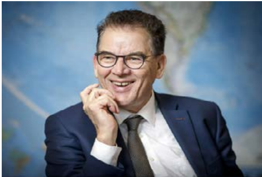
Dr Gerd Müller

Aligné sur le principe de « ne laisser personne pour compte », de l'agenda 2030, ce programme crée des perspectives professionnelles et d'emplois durables pour les jeunes.