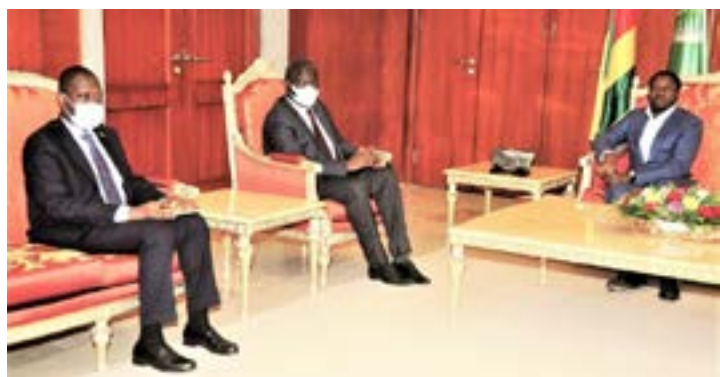
La délégation chez le président de la République