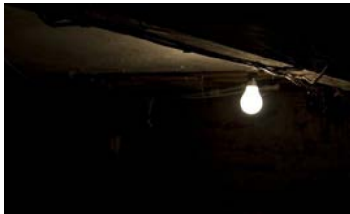
Une ampoule éclairée

d'électrification de 75% en 2025 et de 100% en 2030. Le chemin est encore long. Les actions et stratégies mises en place s'intensifient. L'heure n'est plus aux discours.