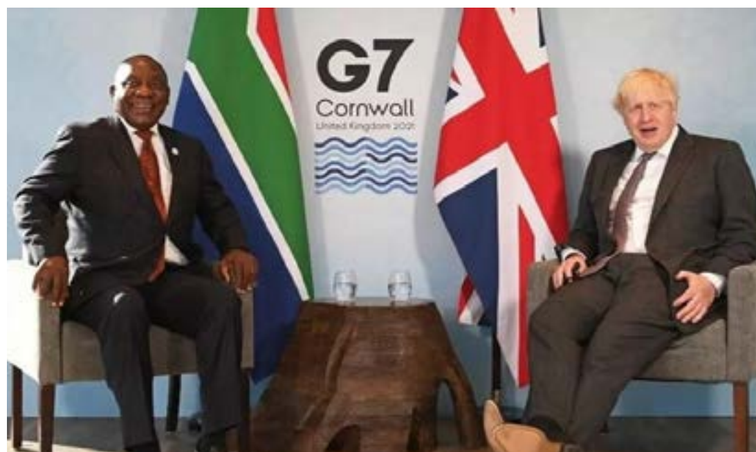
Cyril Ramaphosa et Boris Johnson

« Je veux vraiment saluer le leadership de l'Afrique du Sud et de l'Inde, qui