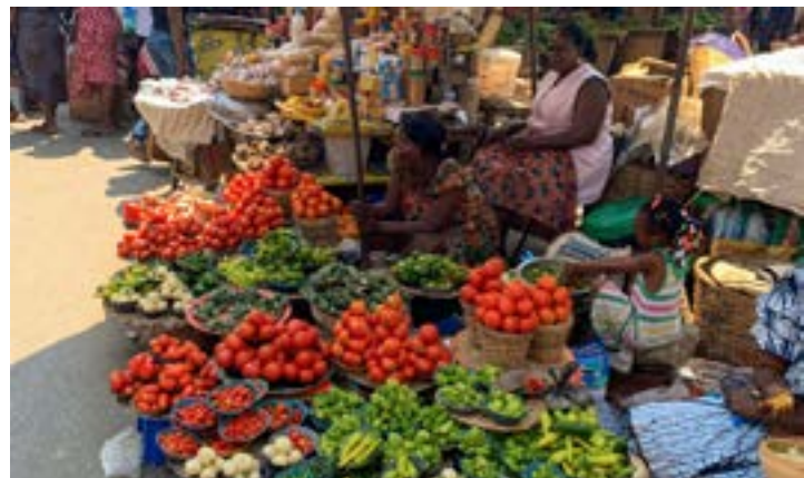
Étalage des produits dans un marché

Il suffit d'un tour dans un marché à Lomé pour entendre des clients qui crient à la surenchère. Les prix des produits de première nécessité connaissent une augmentation sans précédent. Et des opérateurs économiques profitent de la situation.