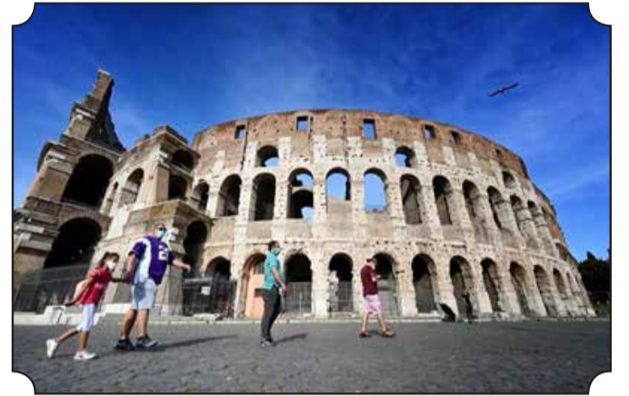
• Des milliers d'Américains doivent se rendre chaque année à des cliniques dentaires itinérantes gratuites pour bénéficier des soins qu'ils ne peuvent s'offrir durant l'année, faute d'assurance, comme ici en Virginie de l'ouest en 2017.

Les soins dentaires ne font pas partie de la couverture santé générale aux États-Unis. «Garder des dents dans votre bouche alors que vous vieillissez ne devrait pas être un luxe dans ce pays», a récemment dénoncé le sénateur progressiste indépendant Bernie Sanders. C'est pourtant le cas