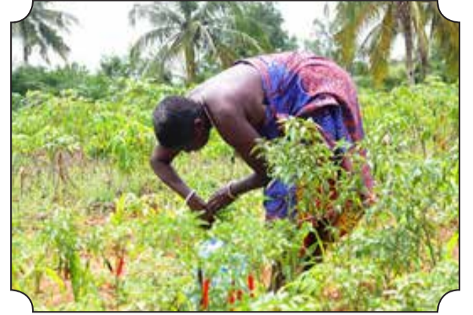
● Une agricultrice dans son champ au sud Togo