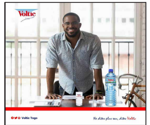
Voltic Togo. Ne dites plus non, dites Voltic.