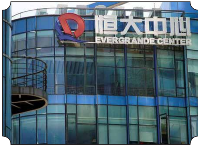
• Le géant de l'immobilier dispose d'un délai de grâce d'un mois pour régler ses dettes. Reuters

Inquiètes des répercussions d'une éventuelle faillite d'Evergrande, les autorités chinoises ont pressé son patron d'utiliser ses deniers personnels pour atténuer la crise, écrit Bloomberg, qui ne précise pas ses sources. Xu