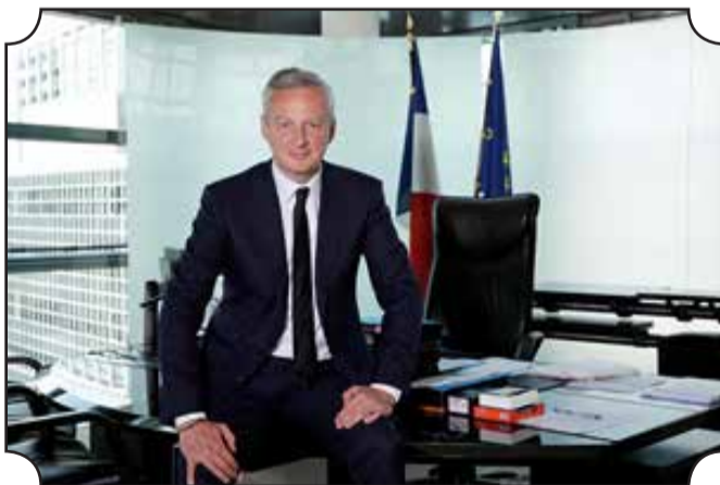
• Le ministre de l'Économie Bruno Le Maire. VQH

La croissance du produit intérieur brut (PIB) français s'est élevée à 3% au troisième trimestre 2021 par rapport au trimestre précédent, un niveau très élevé et dépassant les prévisions, qui permet à la richesse nationale de frôler son niveau d'avant-crise (-0,1%), a estimé vendredi l'Insee. «C'est un chiffre qui est au-delà nos espérances», a déclaré à l'AFP le ministre de l'Économie Bruno Le Maire, le qualifiant de «résultat exceptionnel». Le chiffre de 3% de croissance est supérieur à toutes les estimations faites par les analystes et les institutions, l'Institut national des statistiques